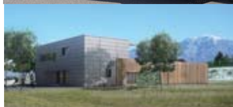
Ouverture en septembre 2010 de la Cuisine Centrale (SCI L'ATELIER ROCHOIS), investissement 1 500 K€.