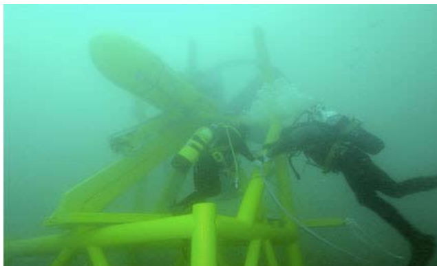
Immersation de Sabella D03 fin mars 2008